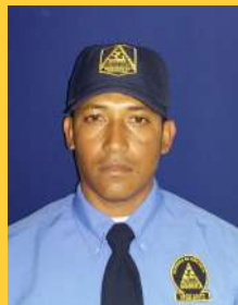
JAIDER RUZ GUERRERO ACROPOLIS EVITA HURTO