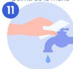
11 Use la toalla para cerrar el grifo