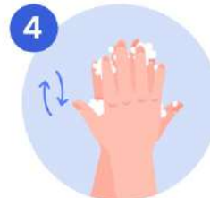
4 Frotese la palma de una mano con el dorso de la otra mano