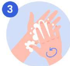
3 Frotese las palmas de las manos