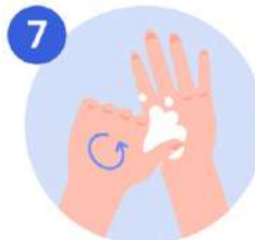
7 Frotese los pulgares con movimiento rotatorio atrapándolo con la palma de la mano