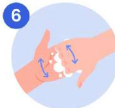
6 Frotese el dorso de los dedos de una mano con la palma de la mano opuesta