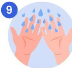
9 Enjuaguese las manos