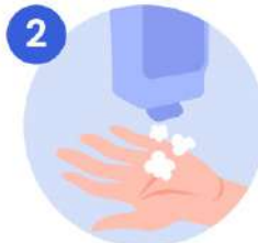
2 Aplique suficiente jabón