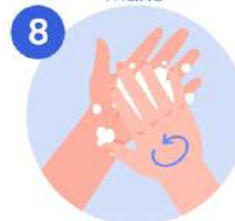
8 Frotese la punta de los dedos con la palma de la mano