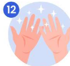
12 Sus manos son seguras