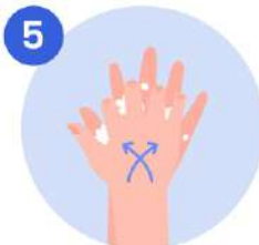
5 Frotese las palmas con los dedos entrelazados