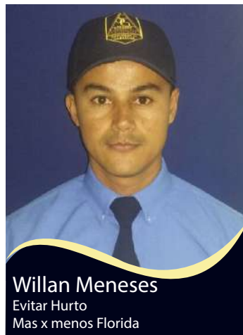
Willan Meneses Evitar Hurto Mas x menos Florida