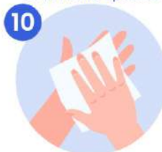
10 Sequese con una toalla desechable