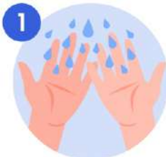
1 Mojese las manos

PROTEGETE Y AYUDA A PROTEGER A LOS DEMAS