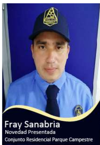
Fray Sanabria Novedad Presentada Conjunto Residencial Parque Campestre