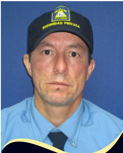
Jaime Jaimes Buen Servicio Al cliente Edificio Jeremy