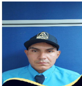
Diego Suarez Excelencia en la Prestación del Servicio Eco Centro Comercial y Empresarial