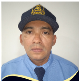
Edinson Bautista Novedad Presentada Conjunto Residencial Cabecera Parque