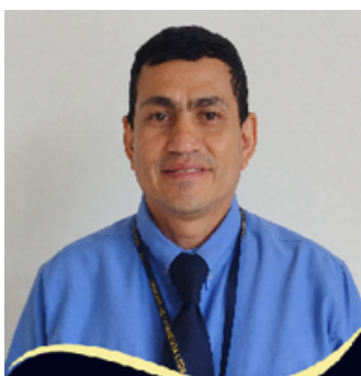
Angel Santos Excelencia en la Prestación del Servicio Urbanización Pinares Condominio